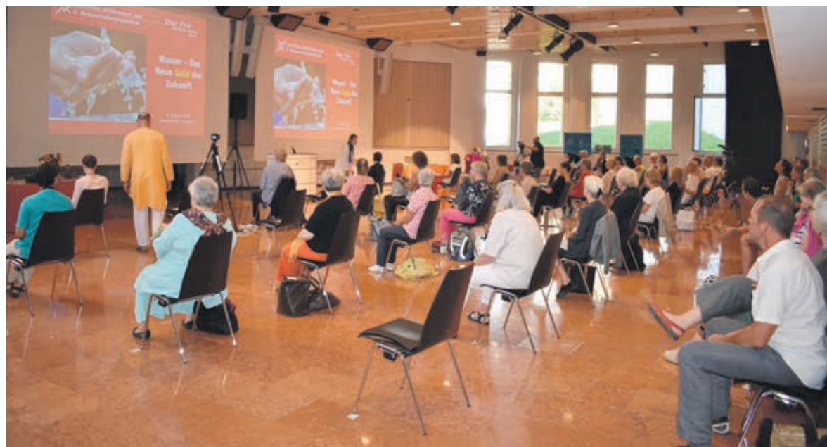
Das Publikum (mit social distance) verfolgte gebannt die spannenden Referate.